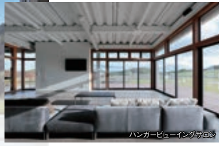
ハンガービューイングサロシ