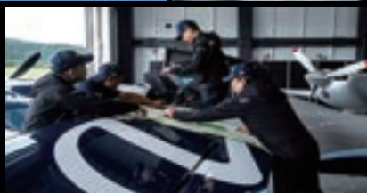
PATHFINDER